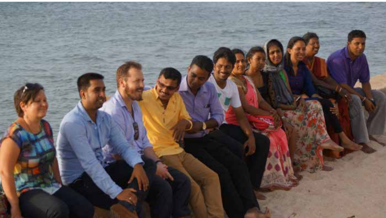
Sri Lankan vuoropuheluhankkeen osallistujia ja fasilitaattoreita

”Työpajat olivat silmiä avaava kokemus. Haluamme käyttää tätä perustuksena tulevaisuutta varten, sillä tuleamme varmasti tulevaisuudessa tapaamaan poliittisissa yhteyksissä ja tämä perusta auttaa meitä ratkaisemaan ongelmia paremmin kuin meitä edeltävä poliitikkojen sukupolvi. Kaikista tärkein oppi on ollut se, että on hyväksyttävää olla eri mieltä. Haluamme jatkaa vuoropuhelua, jotta voimme varmistaa kaikkien osapuolten sitoutumisen demokratiaan ja hyvään hallintoon.”