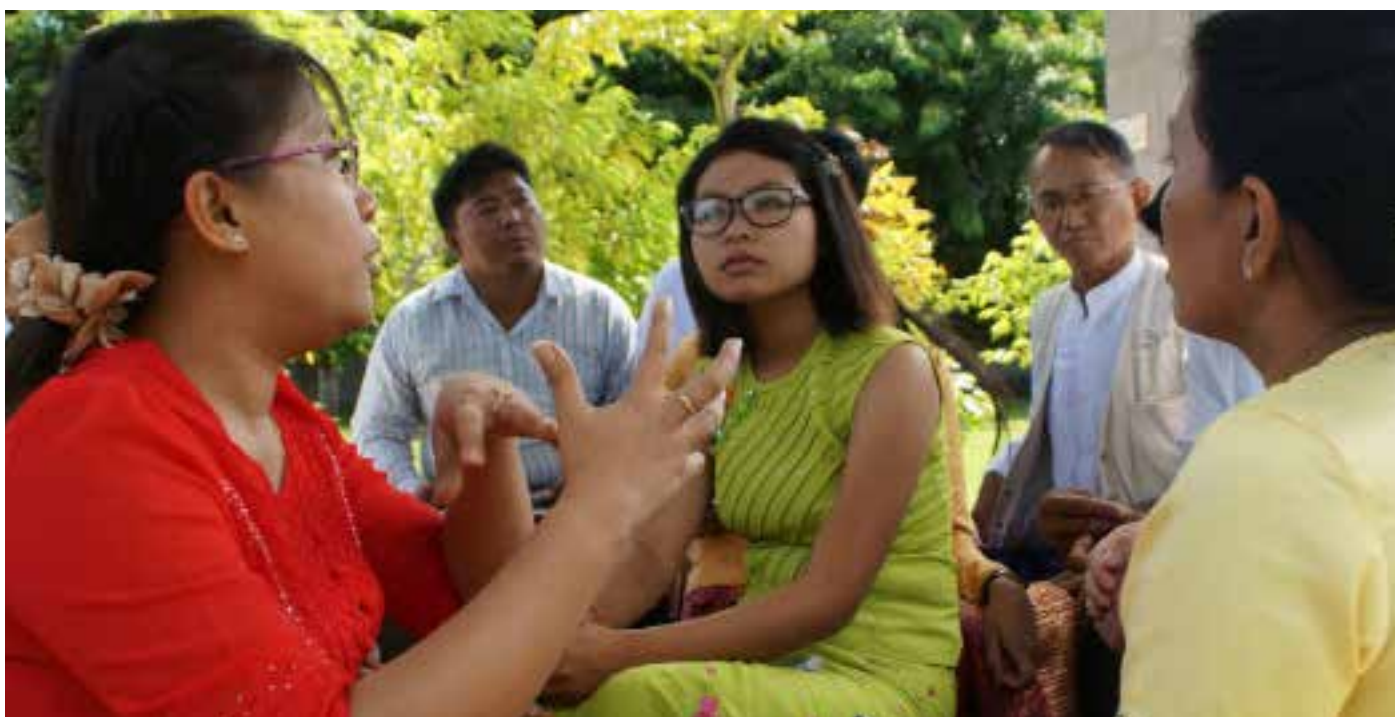
Myanmarin politiikkakoulun alumnit osallistuivat koulutukseen Yangonissa kesäkuussa 2015

Tulitaukosopimuksen jatkoksi aloitettiin tammikuussa 2016 niin sanottu kansallinen dialogi, mikä tarkoittaa laajoja keskusteluja ja prosesseja esimerkiksi perustuslain uudistamiseen, vähemmistöjen oikeuksiin ja liittovaltiomalliin siirtymiseen liittyen. Dialogiin johtanutta tulitaukosopimusta ei tehty kuitenkaan parlamentaarisella tasolla, joten kansallisen dialogin onnistuminen riippuukin nyt pitkälle siitä, miten uusi, marraskuussa valittu parlamentti sitoutuu sen läpiviemiseen, etnisten vähemmistöjen oikeuksien edistämiseen ja samalla vuosikymmeniä jatkuneiden sotilaallisten konfliktien päättämiseen.