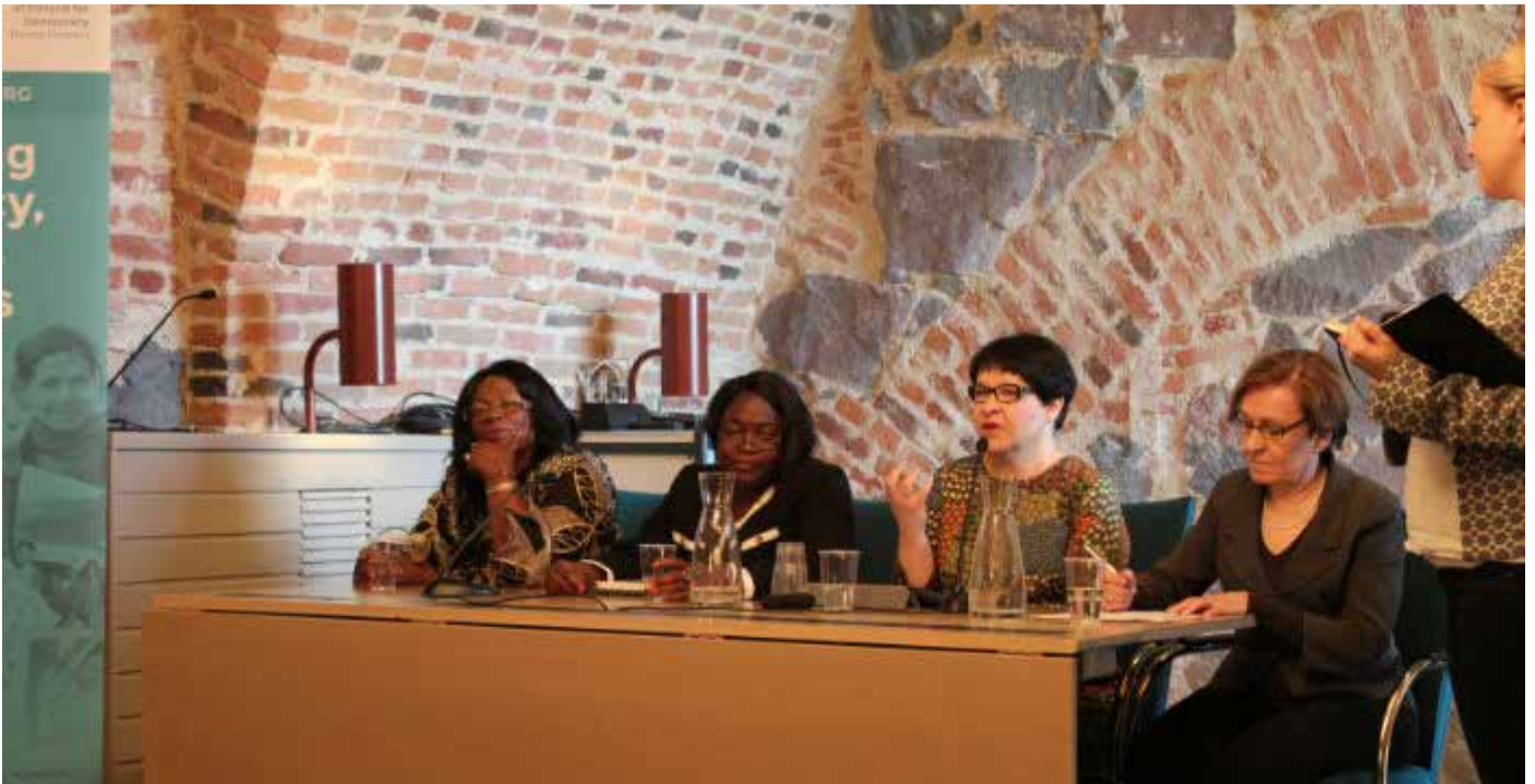
Sambian naispoliitikkojen delegaatio vieraili Suomessa kesäkuussa

Vuoden aikana ZNWL on järjestänyt työpajoja ja naisten puoluerajat ylittäviä tapaamisia valituissa viidessä piirikunnassa eri puolilla maata. Kaiken toiminnan tavoitteena on ollut vahvistaa naisten puoluerajat ylittävää yhteistyötä ja vahvistaa naisten osaamista politiikassa.