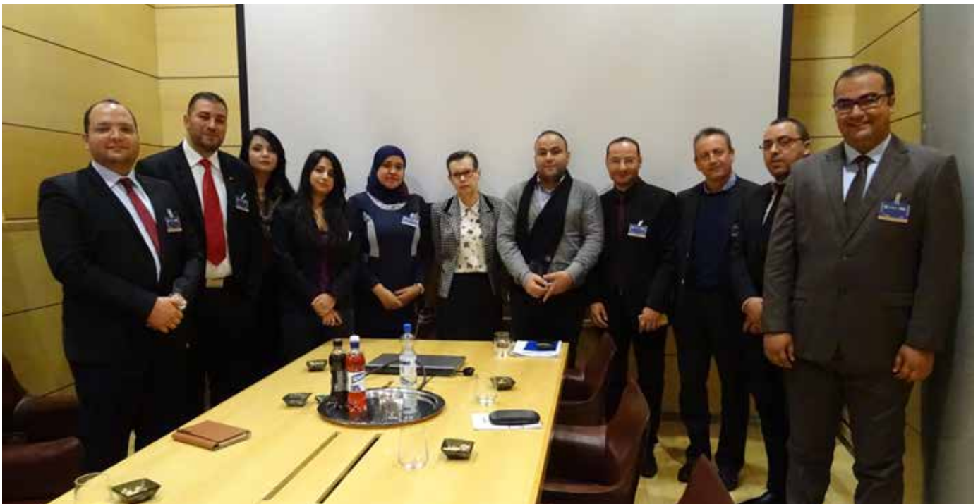
Tunisian politiikkakoululaisia vierailulla eduskunnassa joulukuussa

Puoluetoimijoiden kapasiteetin vahvistamisen osalta Tunisian politiikkakoulun tavoitteena on, että puoluetoimijat edustavat kansalaisten näkemyksiä. Tätä arvioidaan mm. sillä, miten kannattajien ja kansalaisten näkemyksiä on reflektoitu puolueiden tuottamissa ohjelmadokumenteissa ja sillä, kuinka moni puolue perustaa aloitteensa omaan ohjelmaansa. Myös kumppanin kapasiteetin vahvistamista seurataan. Odotettuina tuloksina on puoluetoimijoiden kapasiteetin vahvistuminen kansalaisten ja kannattajien näkemysten huomioimisessa, demokratian peruskäsitteiden hallitsemisessa sekä politiikka-aloitteiden tekemisessä. Myös puolueiden ohjelmallisen työn odotetaan kehittyvän hankkeen aikana. Näiden tavoitteiden ja tulosten saavuttamiseksi tärkein toimintamuoto vuonna 2016 oli politiikkakoulun kurssit sekä alumnien jatkokoulutus, sekä puolueiden strategia- ja ohjelmatyön tukeminen.