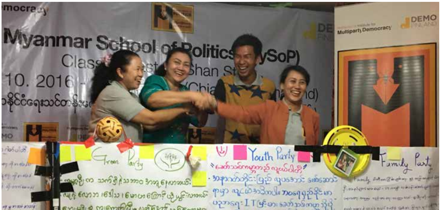
Myanmarin politiikkakoulun peruskurssi järjestettiin itäisen Shanin osavaltion poliitikoille lokakuussa

hengessä. Tätä seurataan sillä, miten usein puoluetoimijat ovat konkreettisesti vuorovaikutuksessa keskenään ja myös kansalaisyhteiskunnan kanssa. Odotettuina tuloksina kulttuurin muutoksen osalta ovat luottamuksen parantuminen sekä puolueiden sisäisen inklusiivisuuden vahvistuminen, erityisesti nuorten ja naisten osallistumisen vahvistumisen kautta.