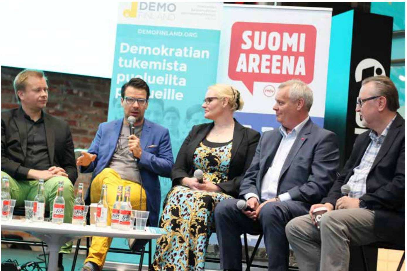
SuomiArenassa keskusteltiin demokratian tulevaisuudesta