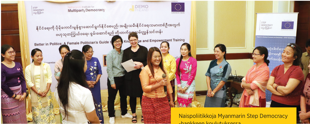
Naispoliitikkoja Myanmarin Step Democracy -hankkeen koulutuksessa.