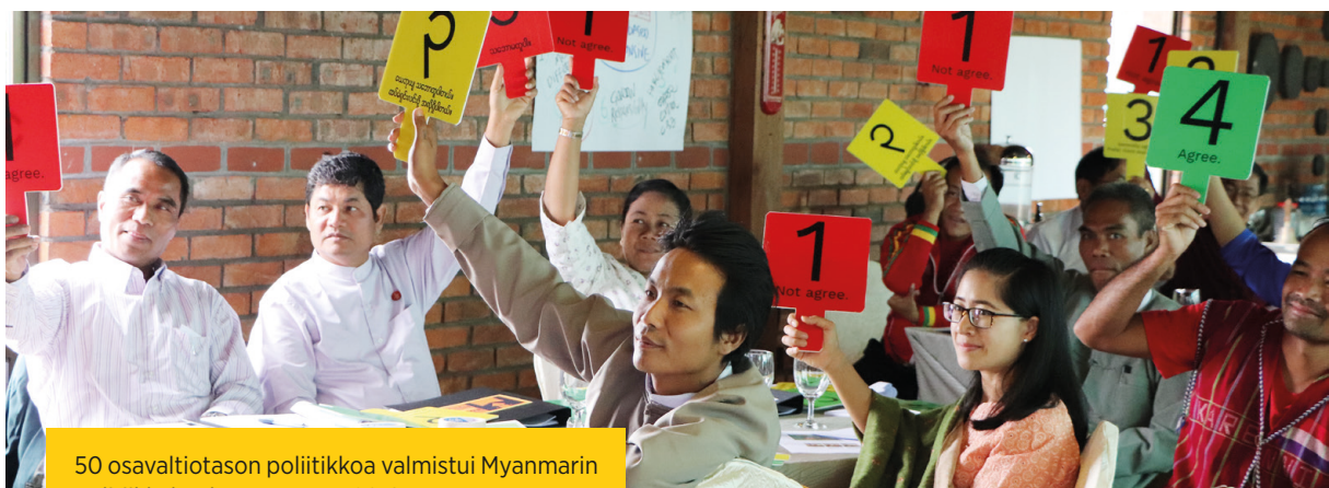
50 osavaltiotason poliitikkoa valmistui Myanmarin politiikkakoulusta vuonna 2019.

Demo on mukana myös EU:n tukemassa, maan laajimmassa demokratiatukihankkeessa (Step Democracy), jota toteutetaan useamman kansainvälisen ja myanmarilaisen organisaation kesken. Demo tukee hankkeessa erityisesti naispoliitikkojen osaamisen vahvistamista sekä tasa-arvon edistämistä puolueissa. 2019 oli hankkeen ensimmäinen kokonainen toimintavuosi. Sen aikana tuotettiin koulu-