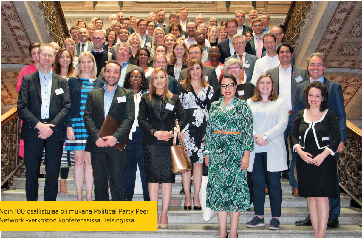
Noin 100 osallistujaa oli mukana Political Party Peer Network -verkoston konferenssissa Helsingissä.

Vuoden 2019 vaaleissa seitsemällä yhdeksästä eduskuntapuolueesta oli sitoumuksia kehitysyhteistyöhön vaaliohjelmissaan. Lisäksi kaksi puoluetta mainitsi demokraatiatuen kehityspolitiikan prioriteettina, ja viisi viittasi demokratiaan joko kehitys- tai ulkopoliitiikan kontekstissa. Demon vaikutus näkyi erityisesti uuden hallitusohjelman sitoumuksessa turvata demokraatiatuen ja oikeusvaltiotuen rahoitus sekä EU:n neuvoston päätelmissä demokration tukemisesta ulkosuhteissa. Päätelmät hyväksyttiin syksyllä 2019. Demo on järjestänyt useita seminaareja ja tapaamisia sekä Helsingissä että Brysselissä ja tuottanut kannanottoja päätelmien päivittämisen tarpeesta. Lisäksi Demoa on kuultu asiantuntijana useissa tilaisuuksissa, kuten EU:n jäsenvaltioiden ihmisoikeustyöryhmässä (COHOM).