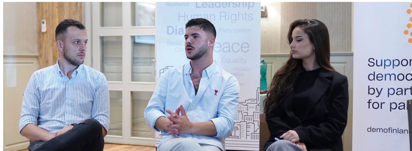
Puolueiden välistä dialogia Kosovossa.