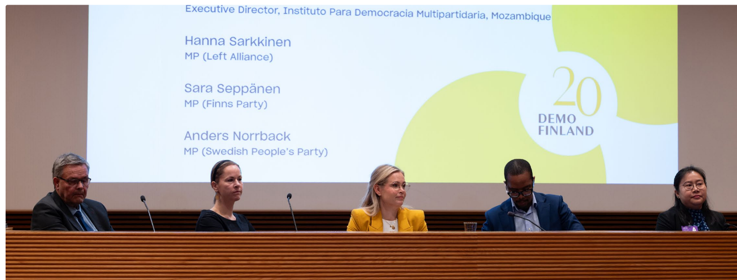
Kansainvälisen demokratiapäivän seminaarin puhujina oli sekä suomalaisia kansanedustajia että Demo Finlandin kumppanijärjestöjen edustajia.