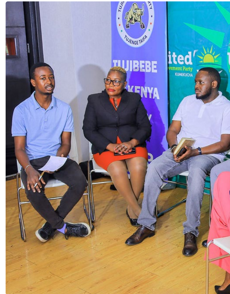
Kenialaisten puolueiden edustajat käyvät keskustelua ja jakavat kokemuksia puolueiden sisäisen demokratian vahvistamisesta.