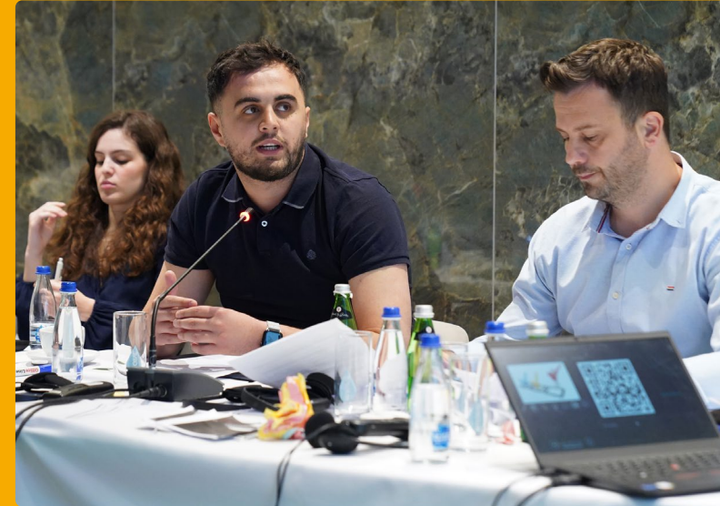
Kosovon Poliitiikkakoulun osallistujia.