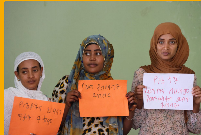
Etiopialaisia naispoliitikkoja koulutettiin viestinnästä ja julkisesta puhumisesta.