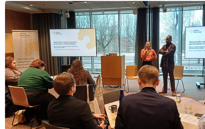
Demokratia-akatemiassa käsiteltiin muun muassa Demo Finlandin ja IMD:n ohjelmaa Mosambikissa.