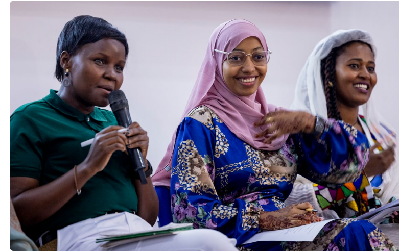
WYDE Civic Engagement -hankkeen konferenssi kokosi Itä-Afrikan alueen nuoria Nairobiin.