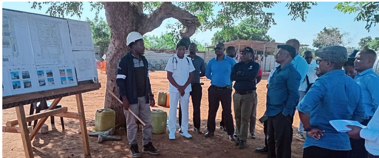
Hankkeessa koulutetut valiokuntien jäsenet tutustumassa maakaasun ja öljyn tuotannon paikallisiin vaikutuksiin Inhassorossa Mosambikissa.