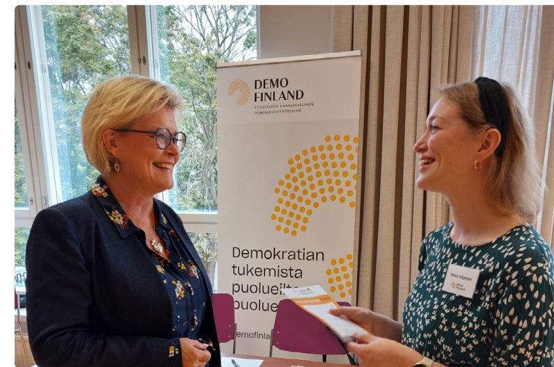
Demo Finland oli mukana jäsenpuolueidensa puoluekokouksissa.