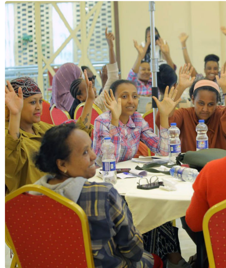
Koulutusta vaaliehdokkuudesta kiinnostuneille vammaisille naisille Addis Abebassa.

Etiopian vaaliviranomainen nimitti 200 vammaista naista toimimaan äänestyspaikkojen tarkkailijoina ja koordinaattoreina vuoden 2026 parlamenttivaaleissa. Edellisissä parlamenttivaaleissa vuonna 2021 vain 15 vammaista naista toimi vaalitarkkailijoina.