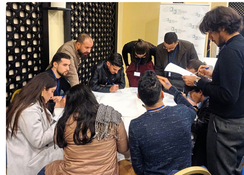
Koulutusta Tunisian politiikkakoulussa.